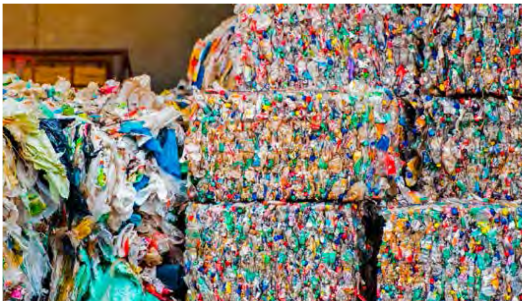
Figura 3. Solo se recicla el 10% de la basura plástica que producimos a nivel mundial