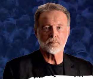
Rafael Bielsa "Federalismo, Desarrollo y Reforma Judicial"