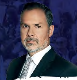
Gustavo Sylvestre "Cuando la mentira es la Verdad, periodismo de guerra, espías y lawfare"