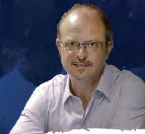
Alejandro Grimson "Tensiones, conflictos y acuerdos en contextos de interculturalidad"