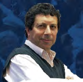
Alfredo Zalat "Crisis económica, deuda y política económica para la pospandemia"