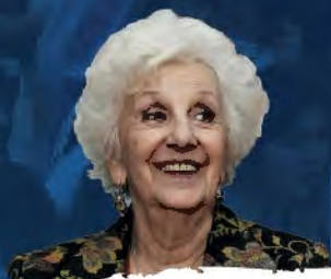
Estela de Carlotto DDHH, Identidad y Memoria. 43 años de lucha